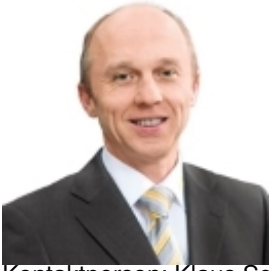
Kontaktperson: Klaus Schumacher