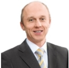
Kontaktperson: Klaus Schumacher